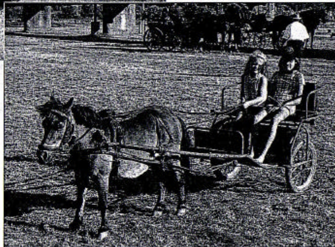
Der Fahrspport begeistert auch die jüngsten Besucher der Pferdesporttage von Kriessern.

Wie es an Pferdesporttagen üblich ist, sorgt eine leistungsfähige Festwirtschaft für das Wohl der Gäste. Für diejenigen, die gar nicht nachhause wollen, sorgt am Abend die Bar. Da ist mit Musik auch für Feststimmung gesorgt. Ein Besuch in Kriessern lohnt sich auf jeden Fall.